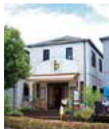
Community Cafe ㇁