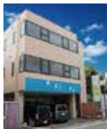
お菓子工房はあもにい

半径20キロ圏内に 真のノーマライゼーション社会の構築を目指し みんなが幸せを感じられる街を次世代に残すために 「はあもにい」は活動を続けていきます。